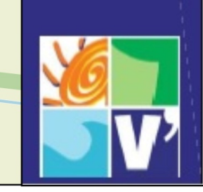
tavola A.4 1: 2.000