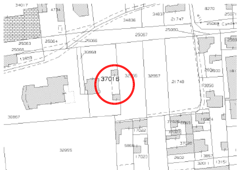
ESTRATTO DI MAPPA C.T. Comune di Busto Arsizio (VA) Foglio 921 Mappale 37016 scala 1:2000